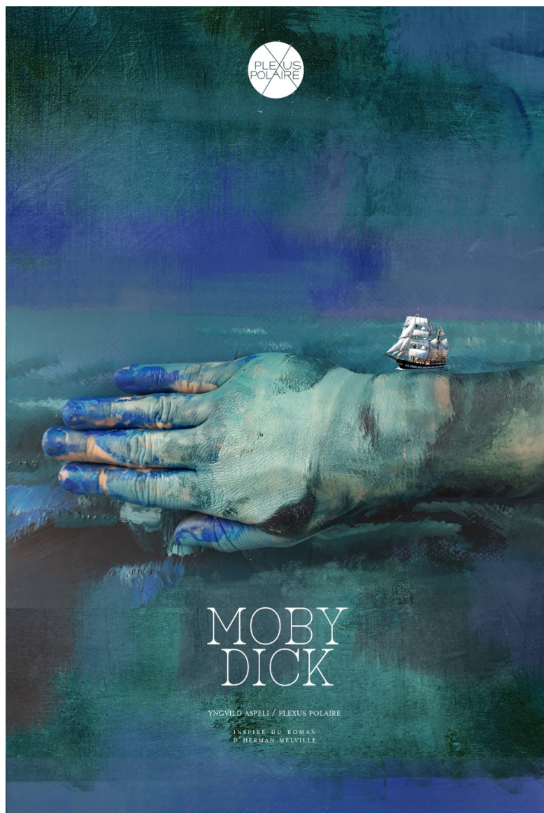
Affiche du spectacle Moby Dick . © Plexus Polaire

Il peut être intéressant de visionner le teaser de la pièce ; pas comme une correction de ce qui a été proposé précédemment mais plutôt comme activité qui dévoile une ambiance, avant d'aller voir le spectacle.