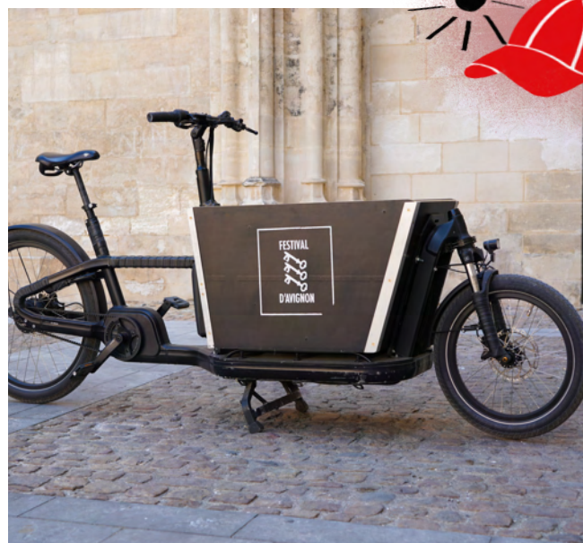
Vélo cargo électrique, 2025