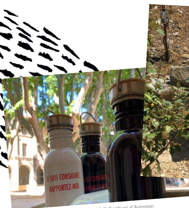
Mise à disposition de gourdes, 2022