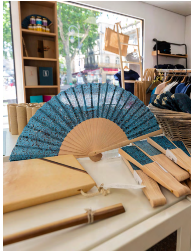
Boutique du Festival, 2021