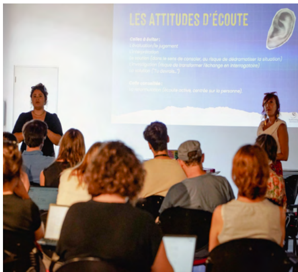
Formation VHSSM, 2025