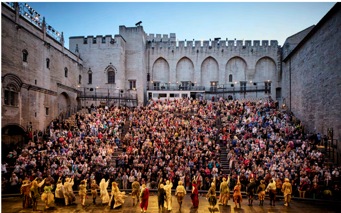
Le Soulier de Satin, Éric Ruf – Comédie-Française, 2025