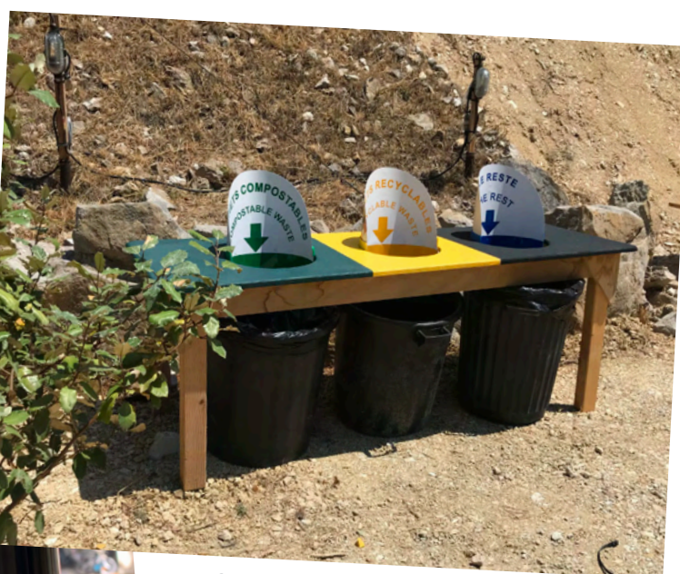
Construction de poubelles à la Carrière de Boulbon, 2025