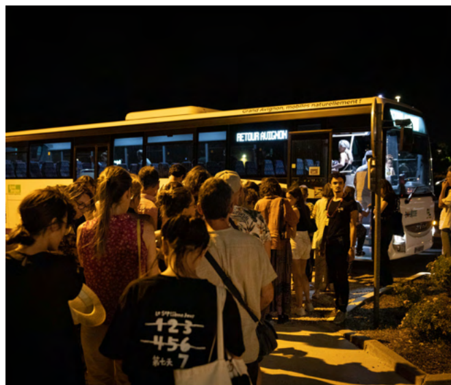
Navettes, L'Autre Scène du Grand Avignon – Védène, 2023