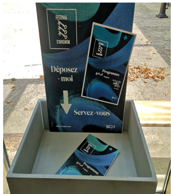
Bac de récupération des programmes, 2025