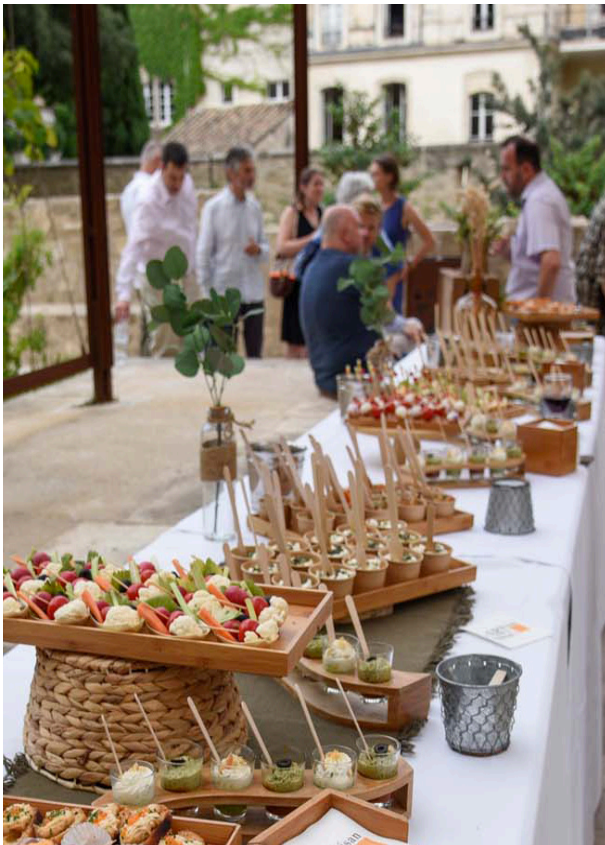
Jardin du Palais des Papes, 2023