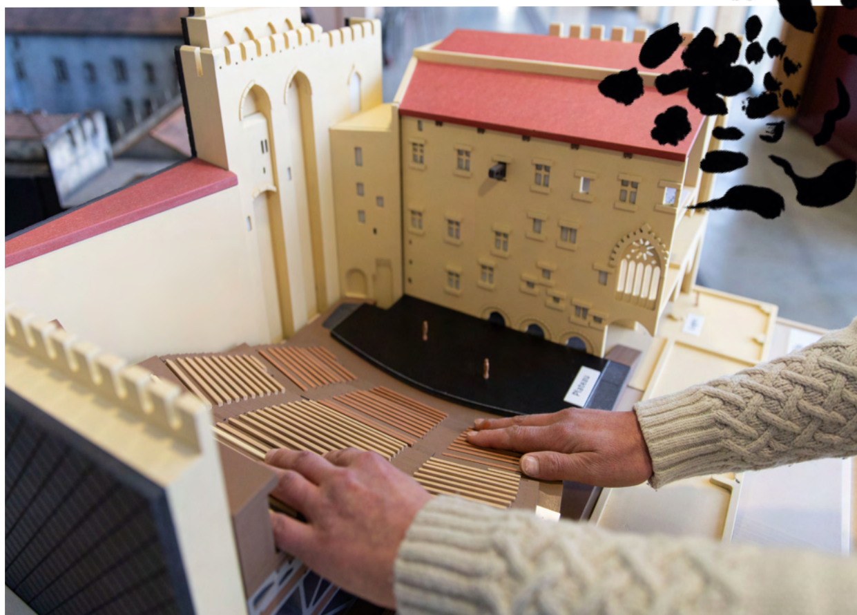
Maquette tactile de la Cour d'honneur du palais des Papes, 2023