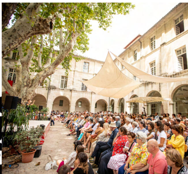
Café des idées, 2025 © Festival d'Avignon

67% DES DÉPLACEMENTS ENTRE LE DOMICILE ET LE LIEU DE SÉJOUR S'EFFECTUENT VIA LE RÉSEAU FERROVIAIRE (TER, TGV, INTERCITÉS)