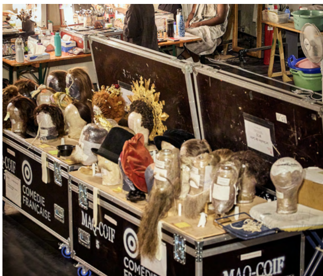
Le Soulier de Satin, Éric Ruf – Comédie-Française, 2025

Le Festival s'engage à repenser les équipements et à promouvoir l'adoption des transports respectueux de l'environnement.