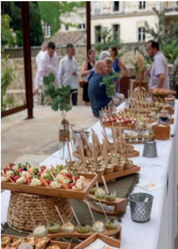
Jardin du Palais des Papes, 2023