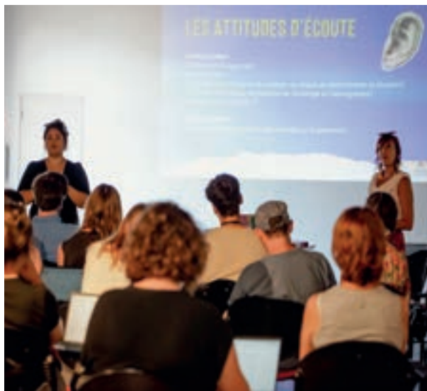
Formation VHSSM, 2025