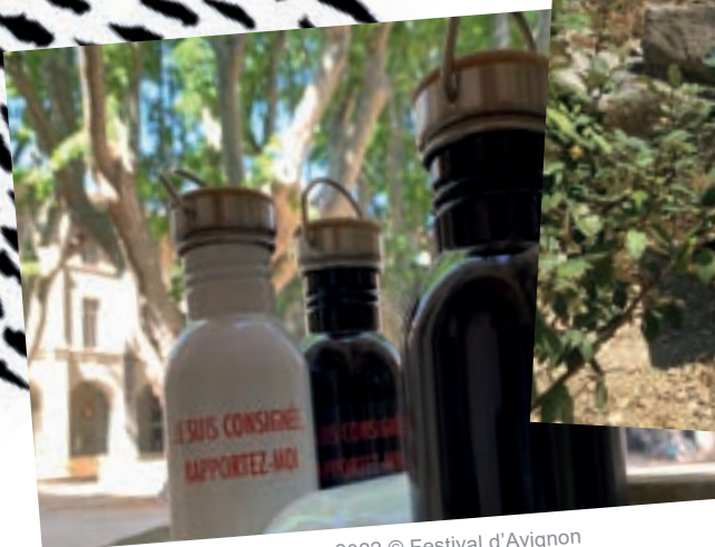
Mise à disposition de gourdes, 2022