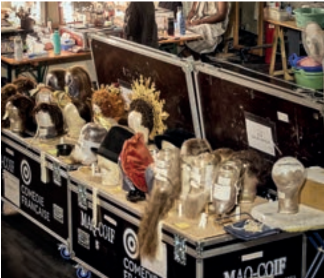
Le Soulier de Satin, Éric Ruf – Comédie-Française, 2025

Le Festival s'engage à repenser les équipements et à promouvoir l'adoption des transports respectueux de l'environnement.