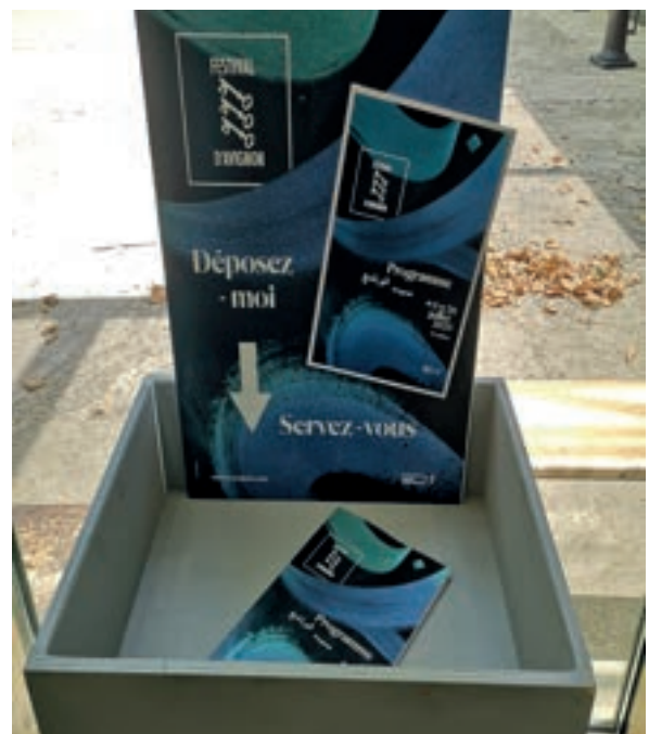
Bac de récupération des programmes, 2025