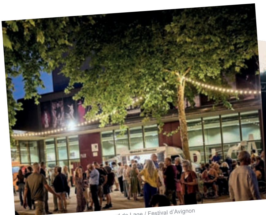
La FabricA, 2025

688M 2 DE SURFACE INSTALLÉE EN OMBRIÈRES ET PANNEAUX PHOTOVOLTAÏQUES À LA FABRICA RÉDUCTION DE 2/3 DE LA CONSOMMATION ÉNERGÉTIQUE