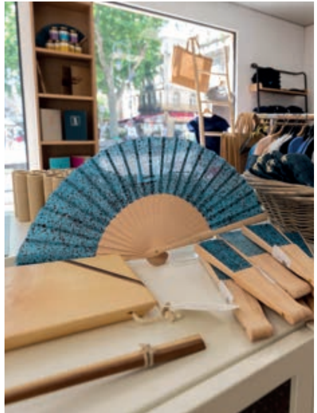
Boutique du Festival, 2021