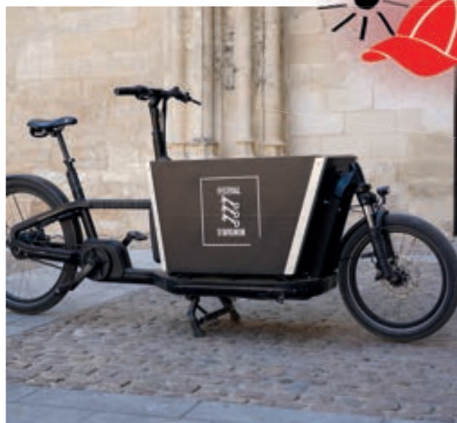
Vélo cargo électrique, 2025