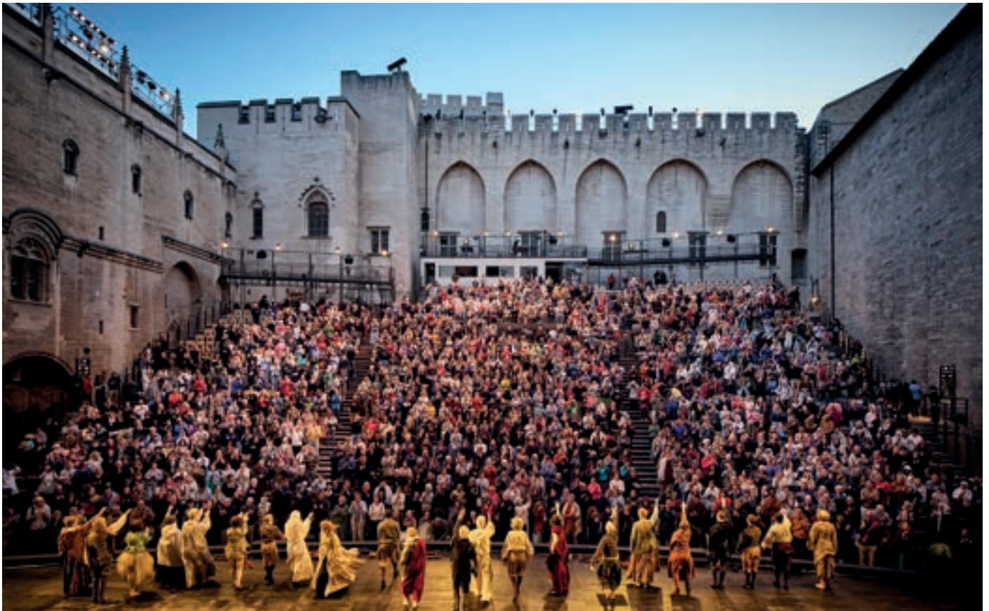
Le Soulier de Satin, Éric Ruf – Comédie-Française, 2025