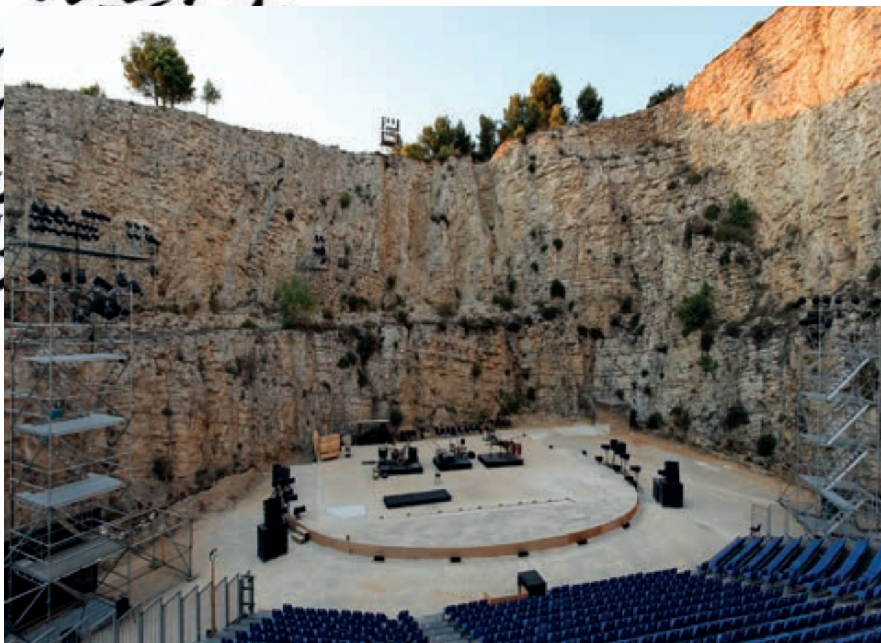
Carrière de Boulbon, 2023