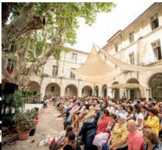
Café des idées, 2025

67% DES DÉPLACEMENTS ENTRE LE DOMICILE ET LE LIEU DE SÉJOUR S'EFFECTUENT VIA LE RÉSEAU FERROVIAIRE (TER, TGV, INTERCITÉS)