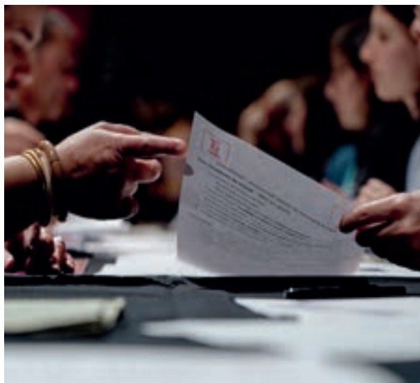
Rencontres pour l'emploi des personnes en situation d'handicap, 2026