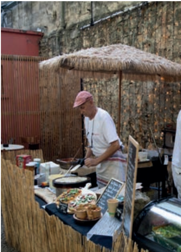
Mahabharata, 2023 © Alexandre Quentin / Festival d'Avignon