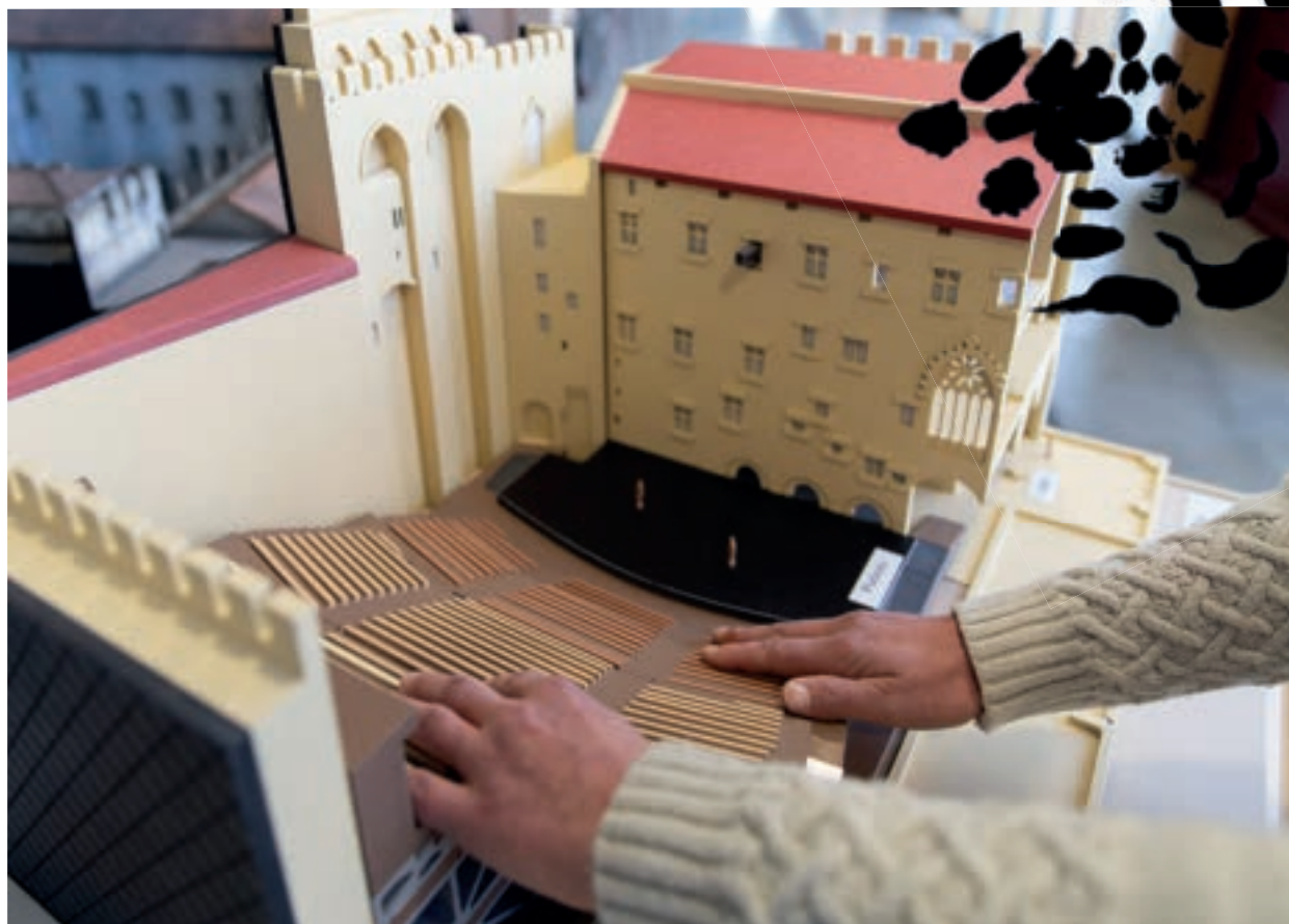
Maquette tactile de la Cour d'honneur du palais des Papes, 2023