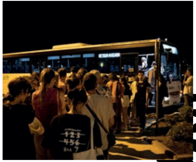
Navettes, L'Autre Scène du Grand Avignon – Védène, 2023