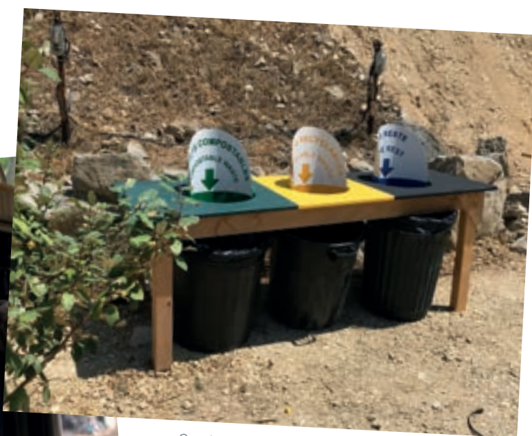
Construction de poubelles à la Carrière de Boulbon, 2025