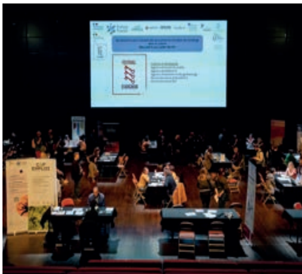
Rencontres pour l'emploi des personnes en situation d'handicap, 2026

En prenant en compte l'intégration de toutes les formes de diversité, le Festival affirme son engagement en faveur de l'inclusion.