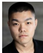
In Hwa JIN Ansan, Corée du Sud