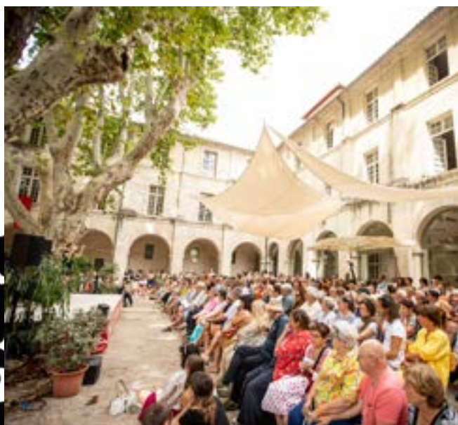
Café des idées, 2025

67% DE TER, TGV ET INTERCITÉS SONT UTILISÉS COMME MODES DE TRANSPORT POUR VENIR DU DOMICILE AU LIEU DE SÉJOUR