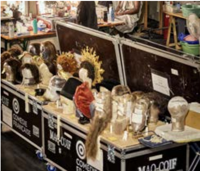
Le Soulier de Satin, Éric Ruf – Comédie-Française, 2025

Le Festival s'engage à repenser les équipements et à promouvoir l'adoption des transports respectueux de l'environnement.