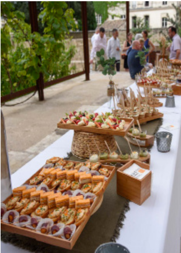
Jardins du Palais des Papes, 2023