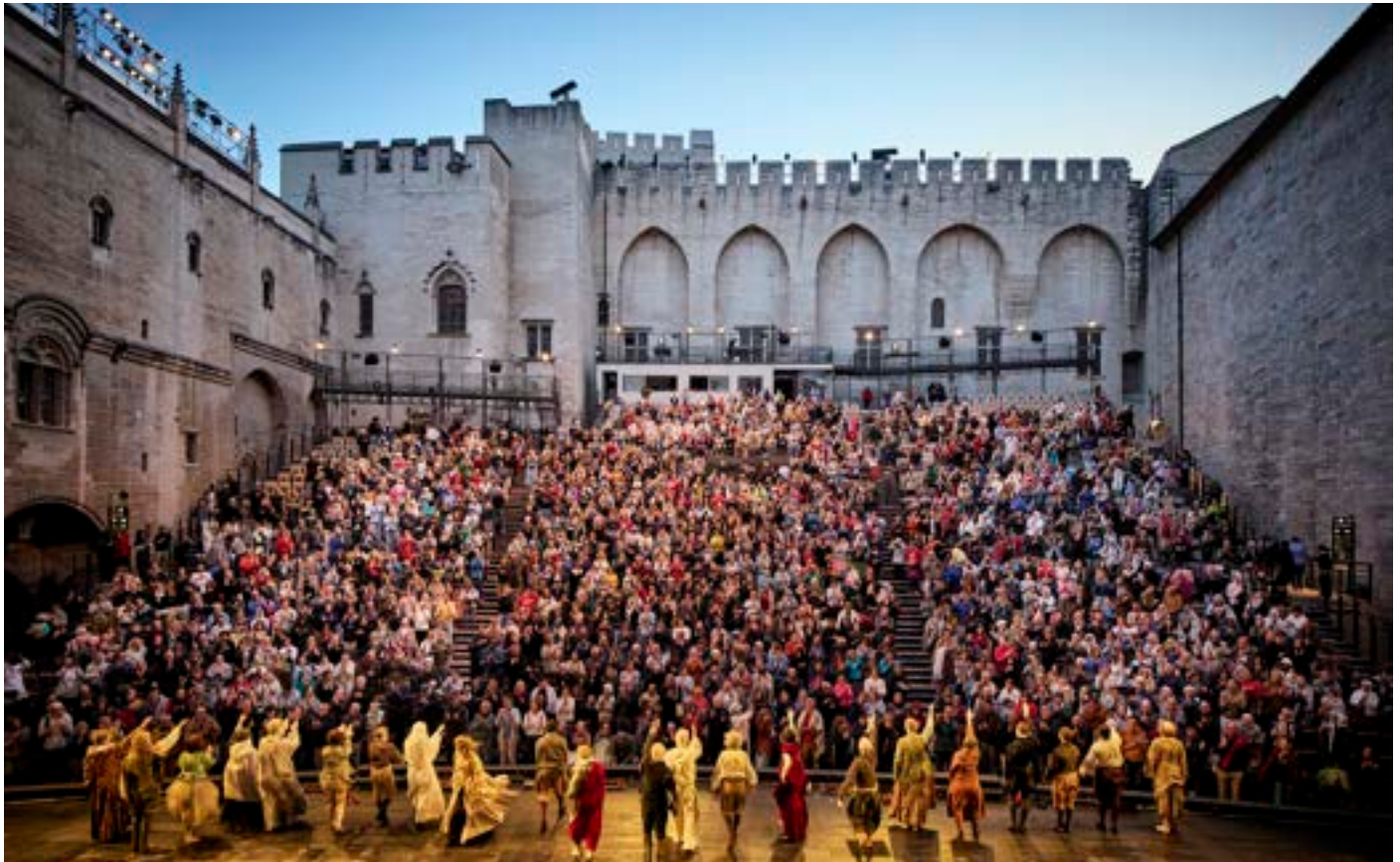
Le Soulier de Satin, Éric Ruf – Comédie-Française, 2025