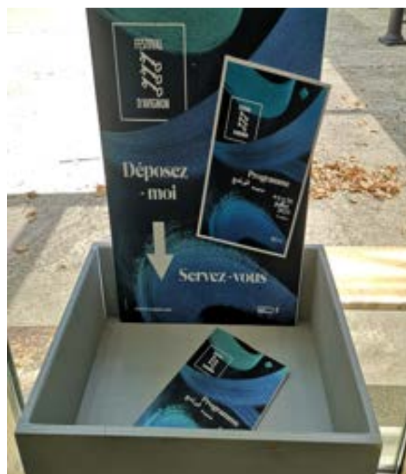
Bac de récupération des programmes, 2025