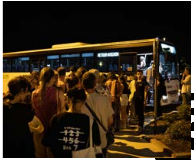
Navettes, L'Autre Scène du Grand Avignon – Vedène, 2023