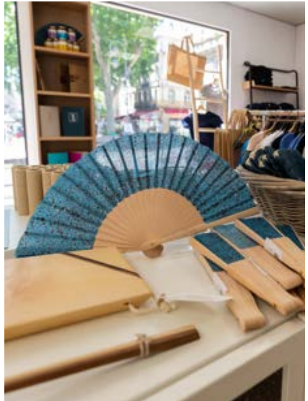
Boutique du Festival, 2021