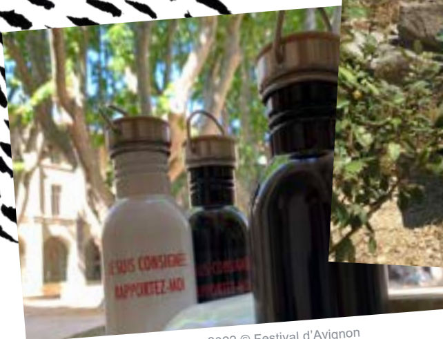
Mise à disposition de gourdes, 2022