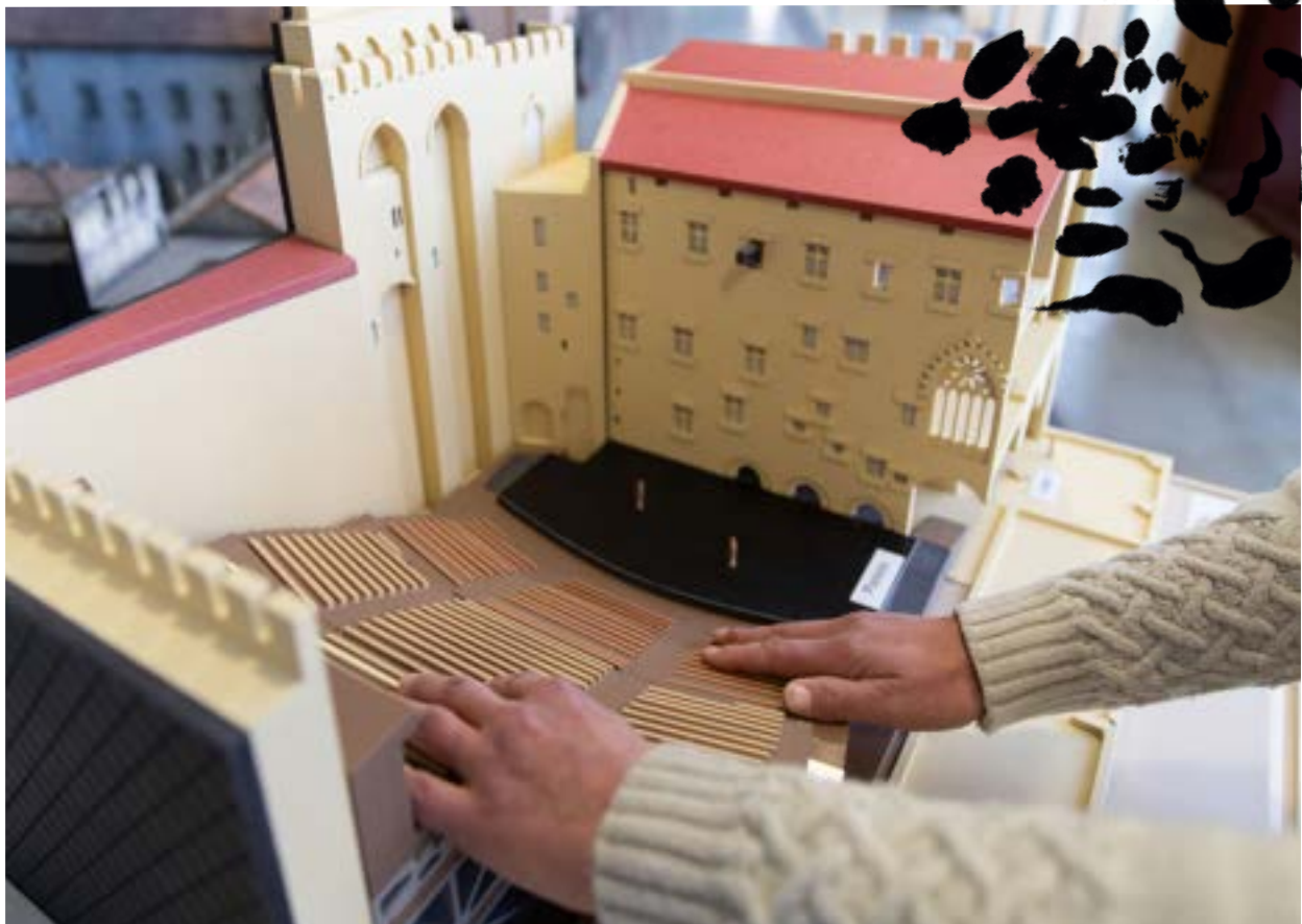
Maquette tactile de la Cour d'honneur du palais des Papes, 2023