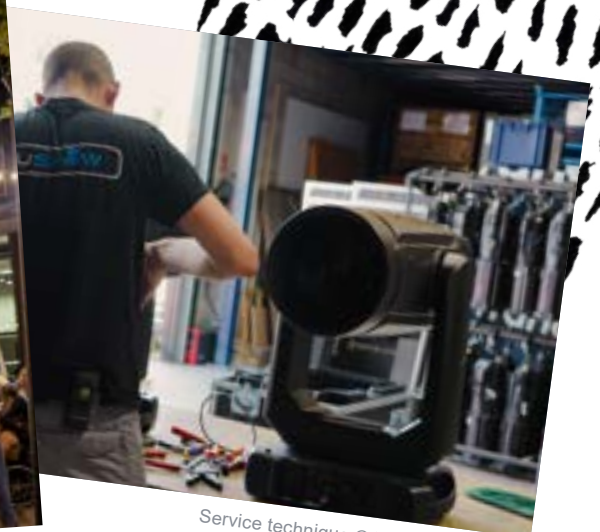
Service technique © Festival d'Avignon