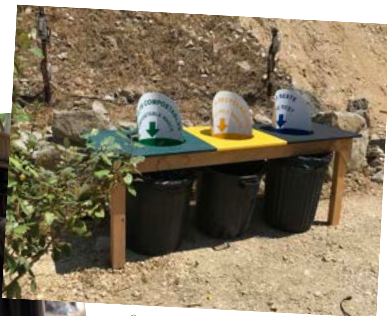
Construction de poubelles à la Carrière de Boulbon, 2025