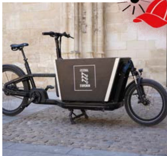
Vélo cargo électrique, 2025