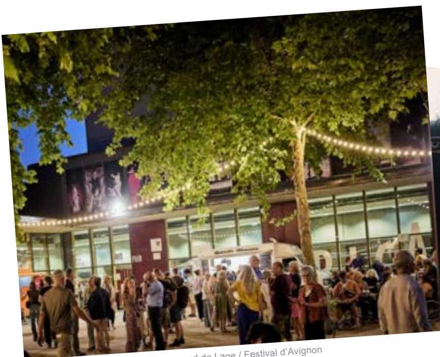
La FabricA, 2025

688M 2 DE SURFACE INSTALLÉE EN OMBRIÈRES ET PANNEAUX PHOTOVOLTAÏQUES À LA FABRICA RÉDUCTION DE 2/3 DE LA CONSOMMATION ÉNERGÉTIQUE