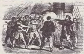
LE FLEAU DES MERS